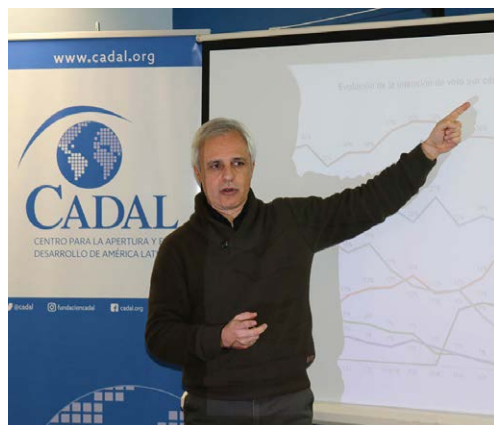
FORO LATINOAMERICANO BUENOS AIRES.

Desde el Music Freedom Day , al seminario "Los derechos humanos en las relaciones internacionales", a la conferencia en el "Día Internacional en Recuerdo de las Víctimas del Totalitarismo" y el Programa "Good bye Lenin", hasta una conferencia sobre "Desafíos a la democracia en América Latina", el 2019 fue un año de destacados eventos organizados por CADAL.