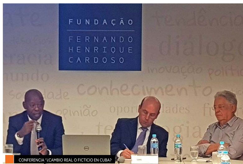
CONFERENCIA "¿CAMBIO REAL O FICTICIO EN CUBA?"