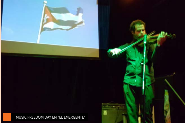
MUSIC FREEDOM DAY EN "EL EMERGENTE"

Activista y Licenciada en Ciencias Políticas