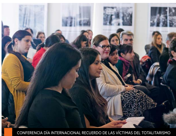
CONFERENCIA DÍA INTERNACIONAL RECUERDO DE LAS VÍCTIMAS DEL TOTALITARISMO