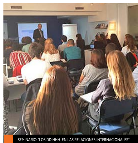
SEMINARIO "LOS DD HH EN LAS RELACIONES INTERNACIONALES"