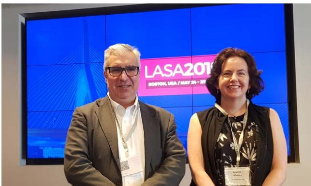
SALVIA Y RHODES EN LA CONFERENCIA ANUAL DE LASA EN BOSTÓN.

En diciembre de 2019 CADAL mudó su sede social al barrio de Retiro, muy cerca de la oficina anterior ubicada en Catalinas, donde funcionó la oficina durante nueve años.