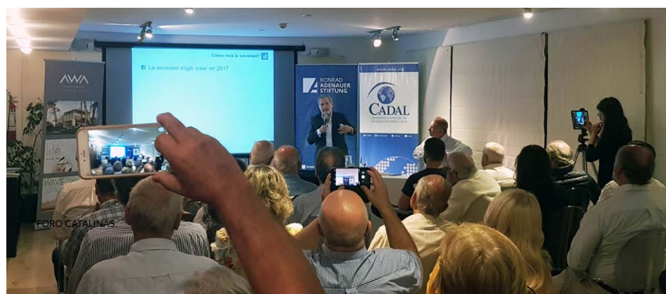
FORO LATINOAMERICANO PUNTA DEL ESTE