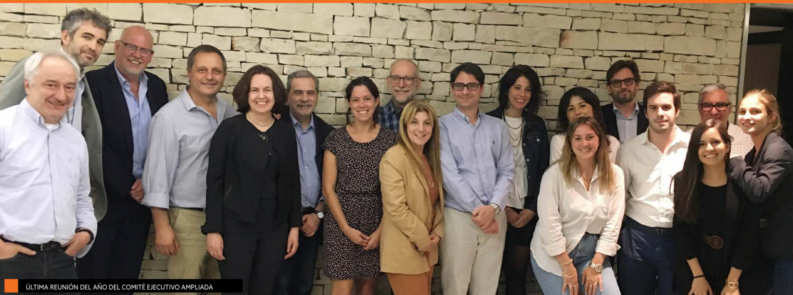
ÚLTIMA REUNIÓN DEL AÑO DEL COMITÉ EJECUTIVO AMPLIADA